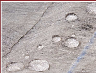
Bloqueador de clima