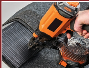
Puede utilizar una pistola de clavos