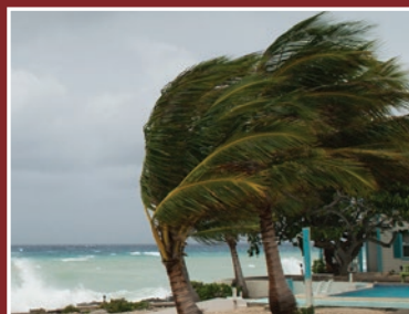
Aprobado por el huracán